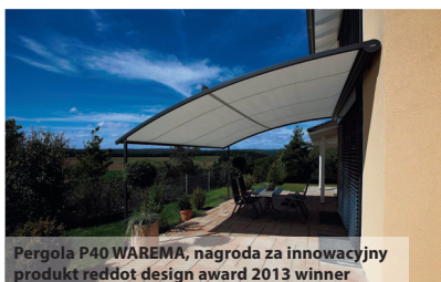
Pergola P40 WAREMA, nagroda za innowacyjny produkt reddot design award 2013 winner