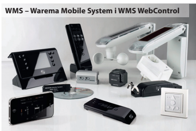
WMS - Warema Mobile System i WMS WebControl