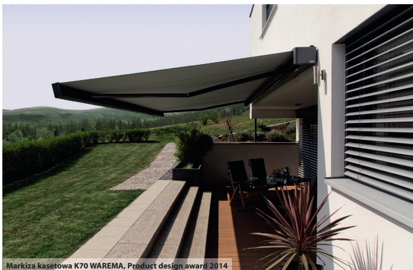
Markiza kasetowa K70 WAREMA, Product design award 2014